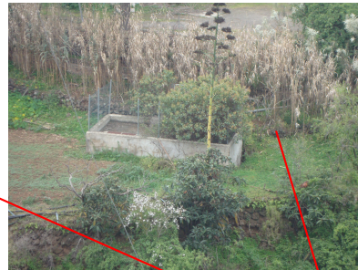
Estación Lomo Lucas baja

Rumes Lunaria (vinagrera), ocupando parte de la estación depuradora